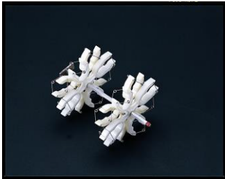
ボトルユニット ※標準付属品