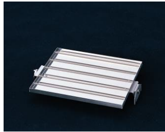
シーソーユニット ※標準付属品