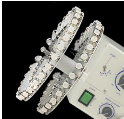
標準装備のホルダー