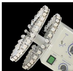
標準装備のホルダー