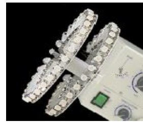
1.5mlマイクロチューブホルダー (※オプション)